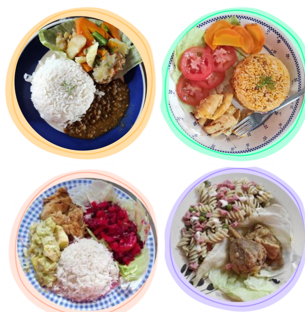
Figura 1. Preparación de platos

Se realizó una comparación de los conocimientos, actitudes y prácticas previa y posterior a las charlas educativas, donde se notó un aumento de respuestas correctas del 60%, demostrando así que tuvieron un efecto positivo (Figura 2).